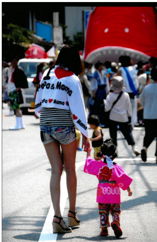
[愛知県神社総代会長賞] ママとお祭りへ 撮影場所 : 南知多町・津島神社